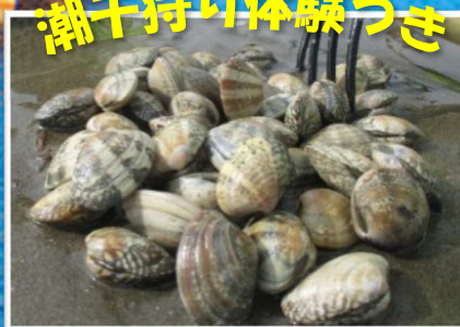
潮干狩り体験つき