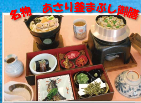
名物 あさり釜まぶし御膳