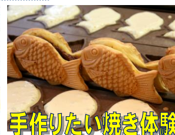
手作りたい焼き体験

<お問い合わせ・お申込み先> 株式会社 グリーントラベル TEL (052) 681-8121 (受付 AM10:00-PM18:30)