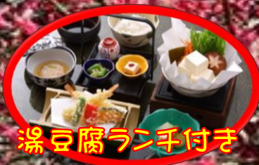
湯豆腐ランチ付き