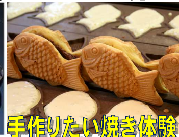
手作りたい焼き体験

<お問い合わせ・お申込み先> 株式会社 グリーントラベル TEL (052) 681-8121 (受付 AM10:00-PM18:30)